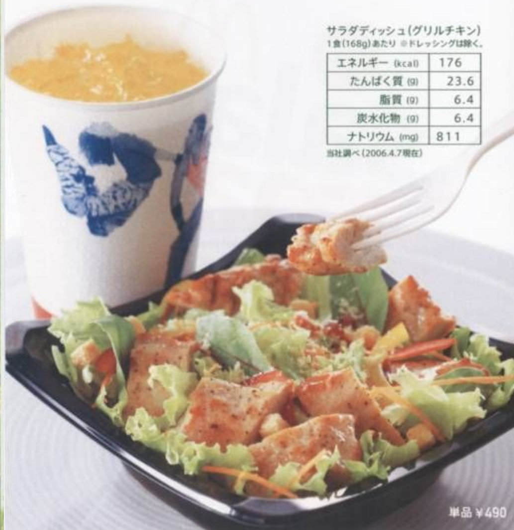
サラダディッシュ(グリルチキン) 1食(168g)あたり ※ドレッシングは除く。

目にもおいしい、彩り鮮やかな野菜がたっぷりのサラダと、 ジューシーに焼き上げたグリルチキンをいっしょにどうぞ。 お好きなドリンクとのセットは、軽いお食事にもぴったりです。