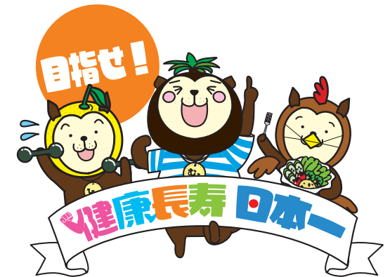
宮崎県シンボルキャラクター 「みやざき犬」